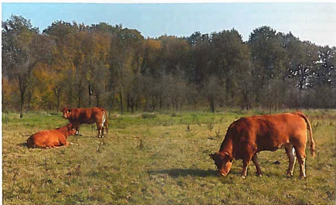
► Do ZD Luke nedaleko Laktaši byly dodány jalovice limousin

Družstvo začalo hospodařit na 110 hektarech vhodných pro sklizeň sena a ovsu, které má v pronájmu od státu. Není bez zajímavosti, že tyto pozemky před válkou využívala Zemědělská univerzita ve Východním Sarajevu pro pokusy s pěstováním obilnin ve vysokých nadmořských výškách. K obhospodařování luk a pastvin dostalo družstvo základní mechanizaci, kterou využívá pro tvorbu zásob sena, rovněž z programu Zahraniční rozvojové spolupráce ČR.