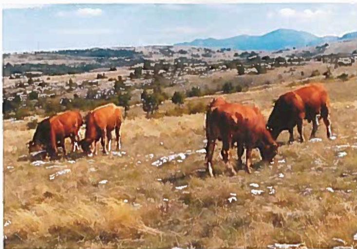
▶ Limousinské byky chovatele Šarace využívají další bosensští chovatelé v plemenitbě

Po skončení války v Jugoslávii došlo postupně ke vzniku sedmi států. Jedním z nich je Bosna a Hercegovina, země oplývající divokou přírodou, těžko přístupnými horami a soutěskami se zurčícími tyrkysově modrými potoky. Ve většině venkovských oblastí nalezneme pouze omezené plochy zemědělské půdy, a i ty se často nachází ve vysokých nadmořských výškách nebo až po překonání těžko přístupného terénu. Obyvatelstvo zde žije jak v pohodlí měst, tak i v podmínkách drsného a divokého venkova. Bosna a Hercegovina je také zemí, kde jsou mezilidské vztahy dodnes silně ovlivněny válečným konfliktem z devadesátých let a přítomností tří většinových národ-