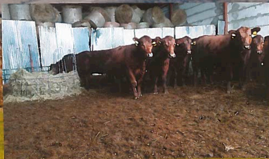
Jalovice z ČR si zvykají na svůj nový domov v Kalinovicu. Jsou ustajeny v provizorní stáji

Nám, jako občanům žijícím v zemi, kde máme více předpisů pro zemědělství než hrbolů na dálnici D1, se tato situace může zdát výhodná. Nicméně je potřeba si uvědomit, že v takov