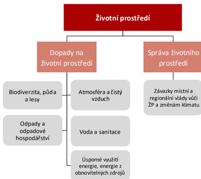
Obrázek 2 Dimenze konceptu Životní prostředí

Na základě uvedeného výčtu pokrývají jednotlivé dimenze a subdimenze navrhované metodiky základní oblasti životního prostředí, jež intervence ZRS ČR mohou ovlivnit. Zároveň zahrnují i způsoby, jimiž je využívání přírodních zdrojů a ochrana životního prostředí řízena a regulována, tj. správa životního prostředí (viz Obrázek 2).